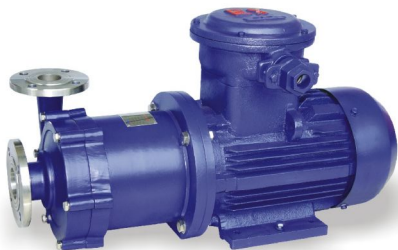
CQ不锈钢磁力驱动泵

磁力泵结构紧凑、外形美观、体积小、噪音低、运行可靠、使用维修方便。可广泛应用于化工、制药、石油、电镀、食品、科研机构、国防工业等单位抽送酸、碱液、油类、稀有贵重液、毒液、挥发性液体，以及循环水设备配套、过滤机配套。特别是易漏、易燃、易爆液体的抽送，选用此泵则更为理想。